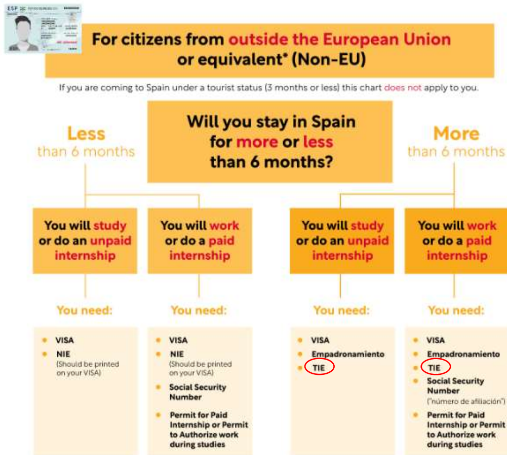
Figure 2: Information for Non-EU citizens